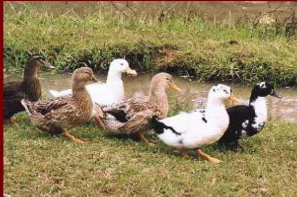
Vit Bau QUY CHAU