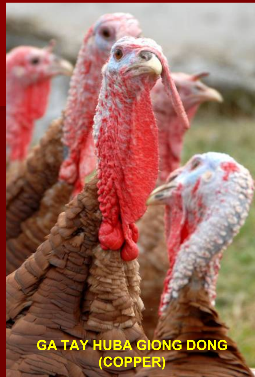
GA TAY HUBA GIONG DONG (COPPER)