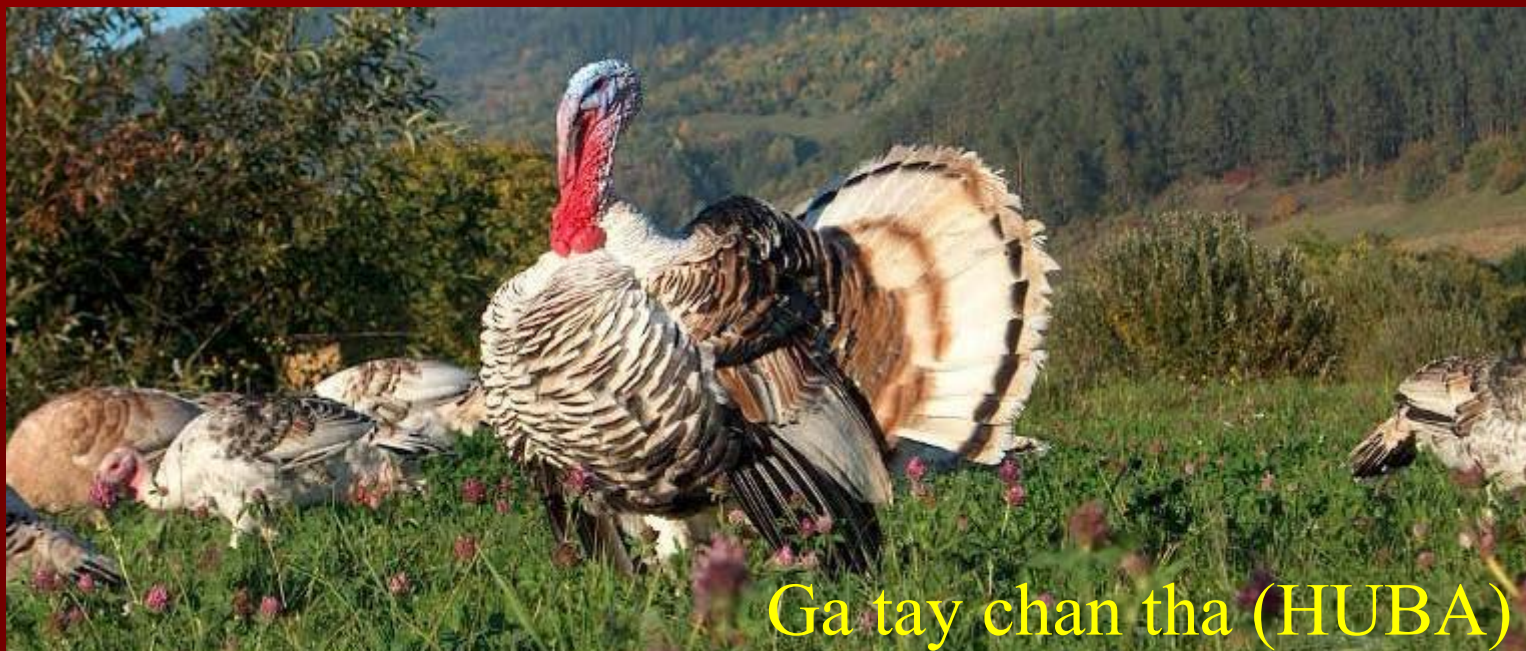
Ga tay chan tha (HUBA)