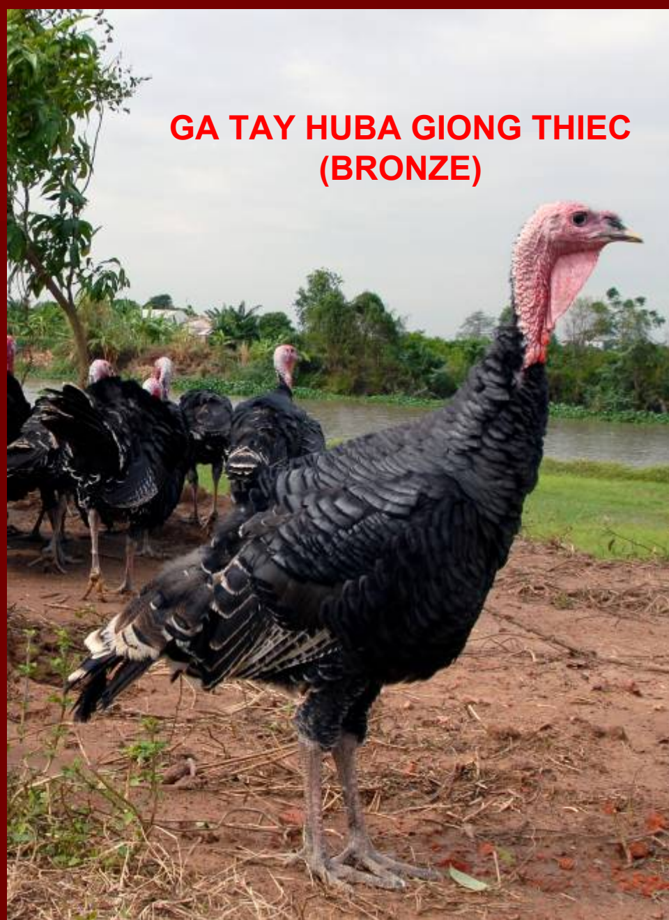
GA TAY HUBA GIONG THIEC (BRONZE)