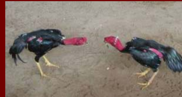
Ga Choi BINH DINH

Viet Nam la chiec noi cua cac giong gia suc dia phuong quy hiem can duoc bao ton gen. Khi phat trien chan nuoi chung ta can quan tam dac biet den: 1- su bao ton cua su tinh khiet cua cac nguon gen, 2- bao ve sinh thai va thien nhien dia phuong