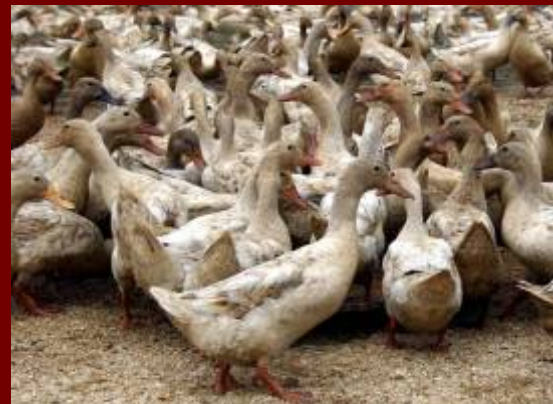
Vit BINH DINH