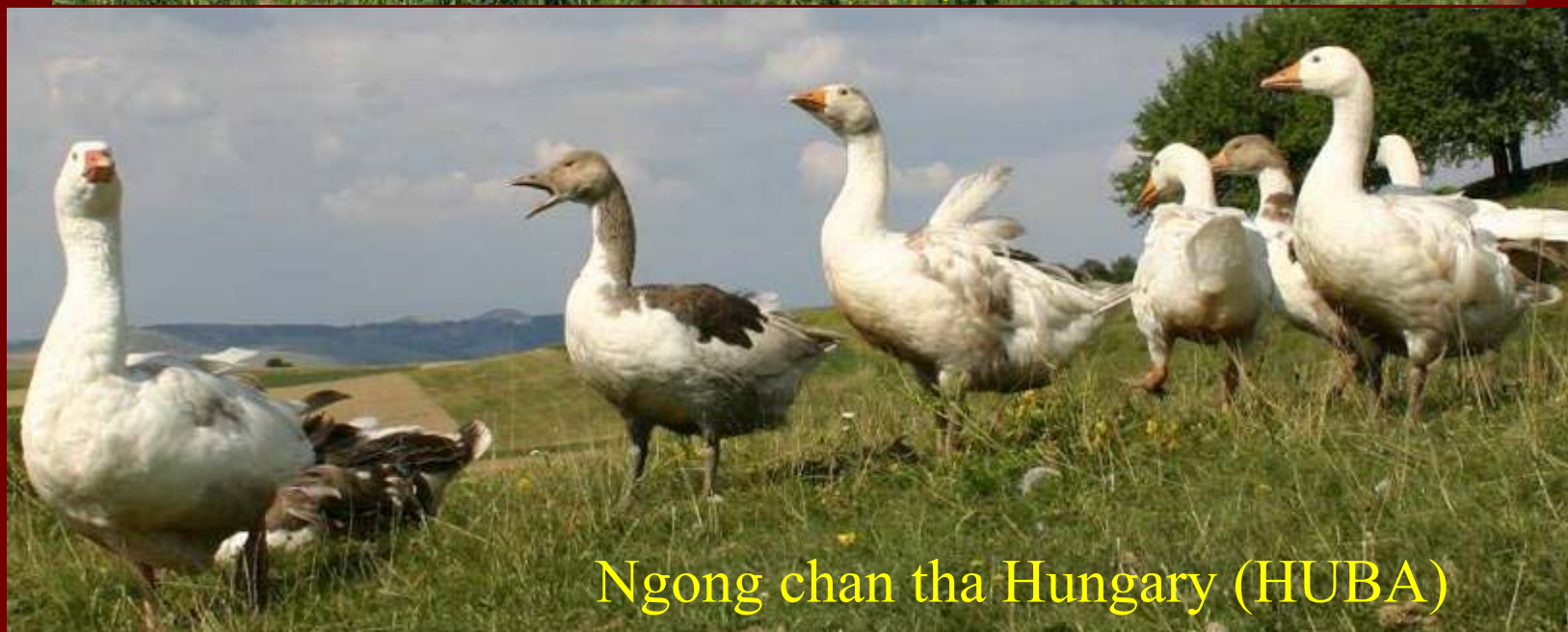
Ngong chan tha Hungary (HUBA)

Giong duoc chon thich hop voi nen san xuat nho kinh te gia dinh, va ho tro su bao ve moi truong