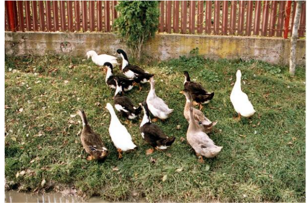
Magyar kacsza színváltozatok (Mezőszilvás, Mezőség, 2005); Fotó: Szalay István