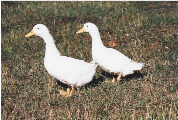
Fehér magyar kacsák (Gödöllő, 2000); Fotó: Szalay István